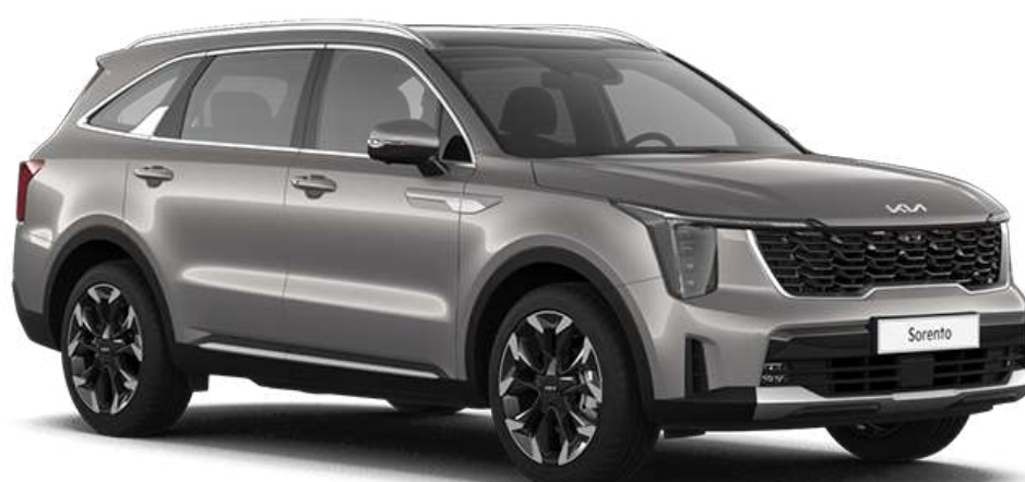
Volcanic Sand Brown (BNQ)