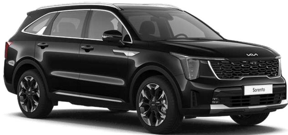
Aurora Black Pearl (AWB)