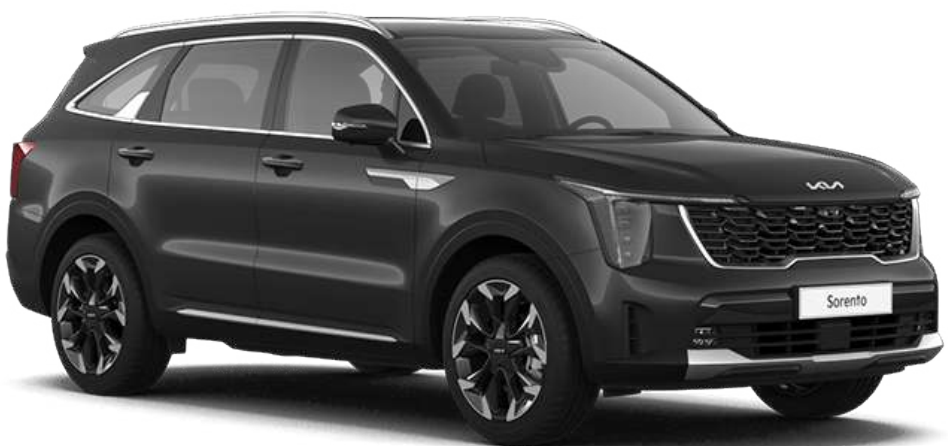
Interstellar Gray (AGT)